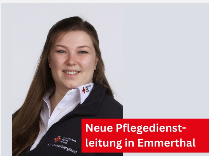
Neue Pflegedienstleitung in Emmerthal