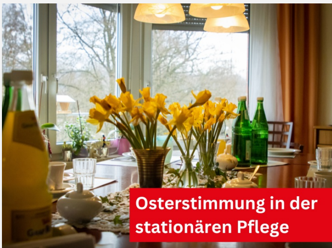
Osterstimmung in der stationären Pflege